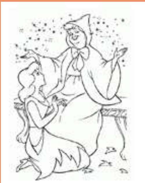
Imagen de Cenicienta